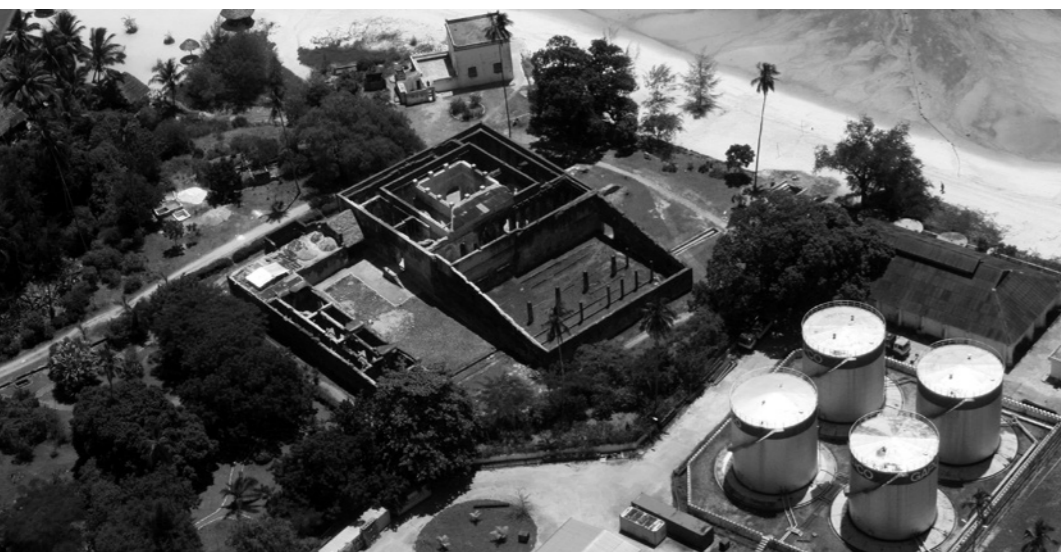
▲ Mtoni Palace Zanzibar, FBW Architecten. ▼ Meubilair Fogo Island Inn, Ineke Hans.

In de afgelopen jaren is er mede door de crisis een beweging gaande waarin het ego van de sterarchitect heeft plaatsgemaakt voor een sociaal betrokken houding en dienstbaar ontwerpen. Designwoningen voor de kleine beurs, het creëren van meer sociale cohesie door middel van stedelijke ingrepen of het bouwen van scholen in de derde wereld zijn allemaal uitingen van deze nieuwe positie. Voor het symposium Towards Architecture as a social Tool heeft CASA vier sprekers uitgenodigd die verschillende aspecten van maatschappelijke betrokkenheid in de architectuur vertegenwoordigen.