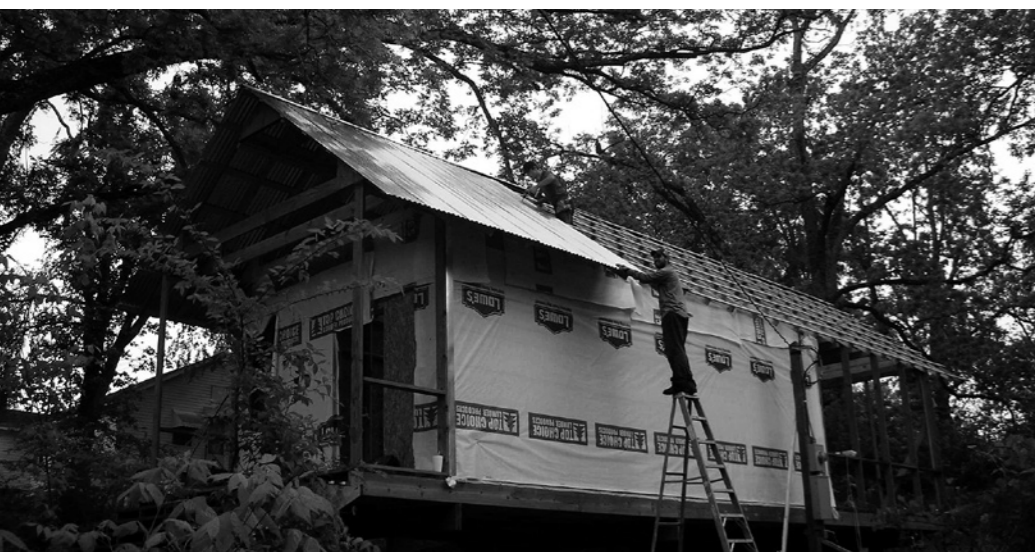
▲ 20K house, Rural Studio. ▼ Workshop, NDVR